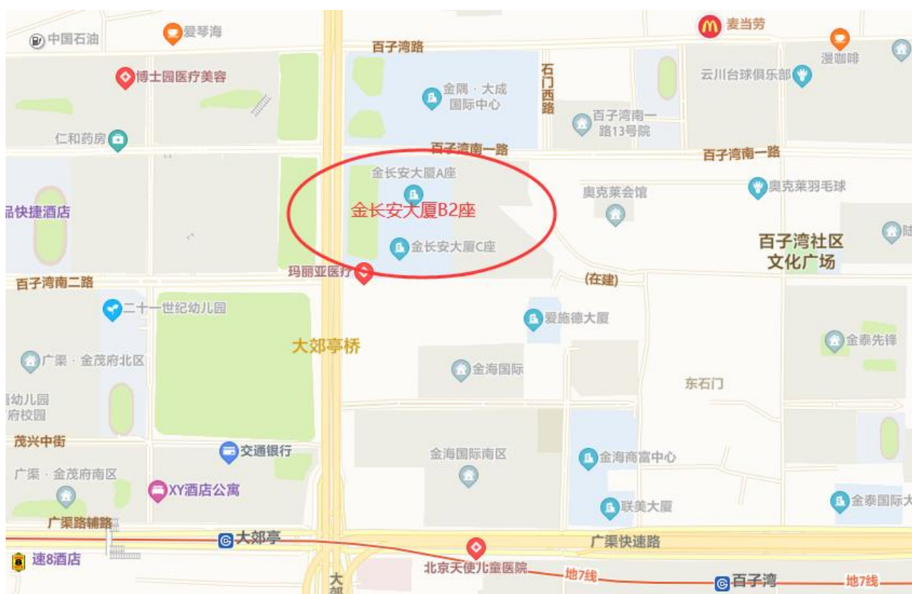
北京恩格威认证中心有限公司位置示意图

乘车路线：NGV位于朝阳区东四环中路82号金长安大厦B2座，地铁7号线大郊亭站B口向北步行600米即到；公交车138、455、657、865路百子湾桥南下车即到。